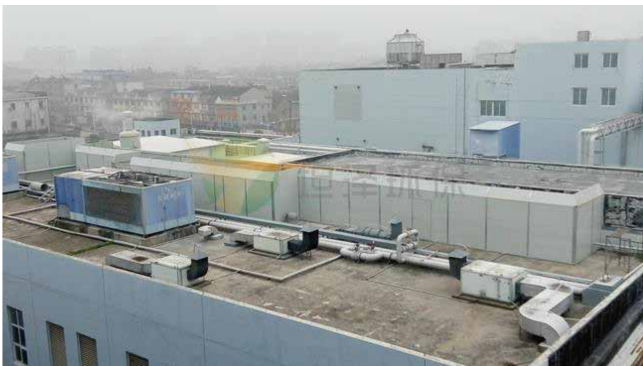
江苏艾兰得营养品有限公司综合降噪项目