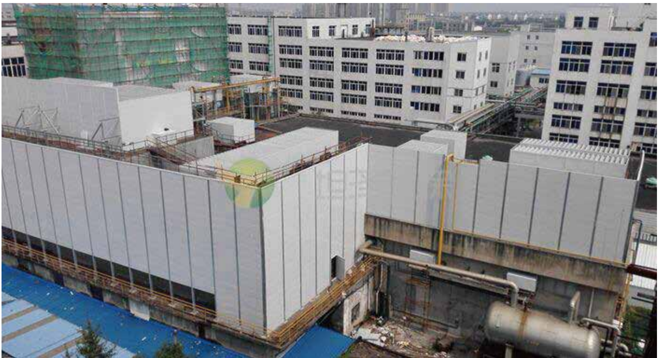
帝斯曼江山制药厂界综合降噪项目（一期）