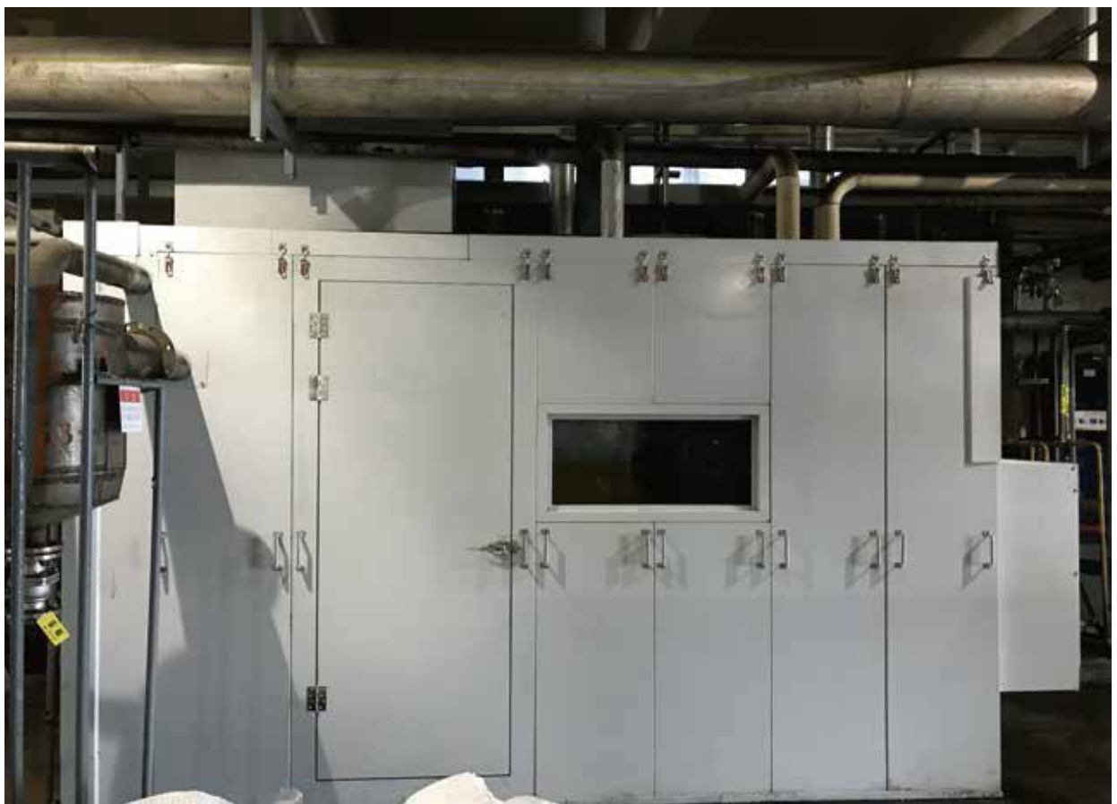
帝斯曼江山制药部分界区及岗位降噪工程（六期）