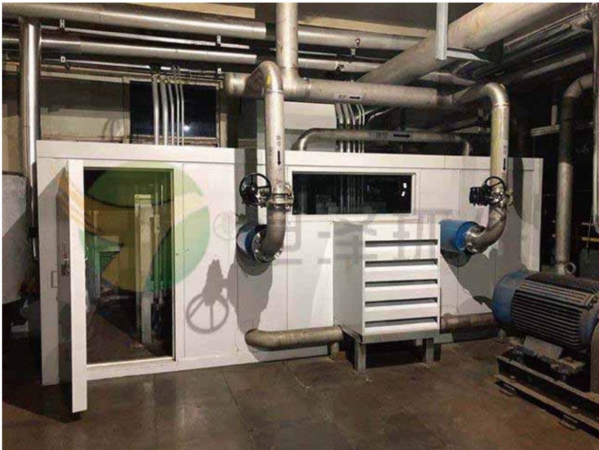
帝斯曼江山制药（江苏）有限公司 208 车间降噪工程（五期）