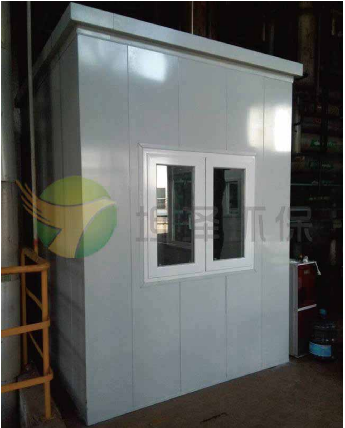
帝斯曼江山制药车间降噪项目（三期）