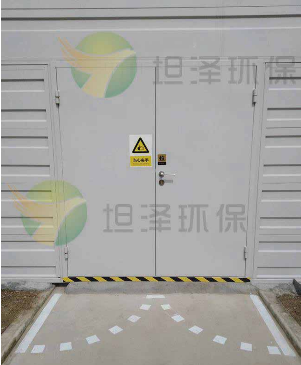
帝斯曼星火厂界综合降噪项目