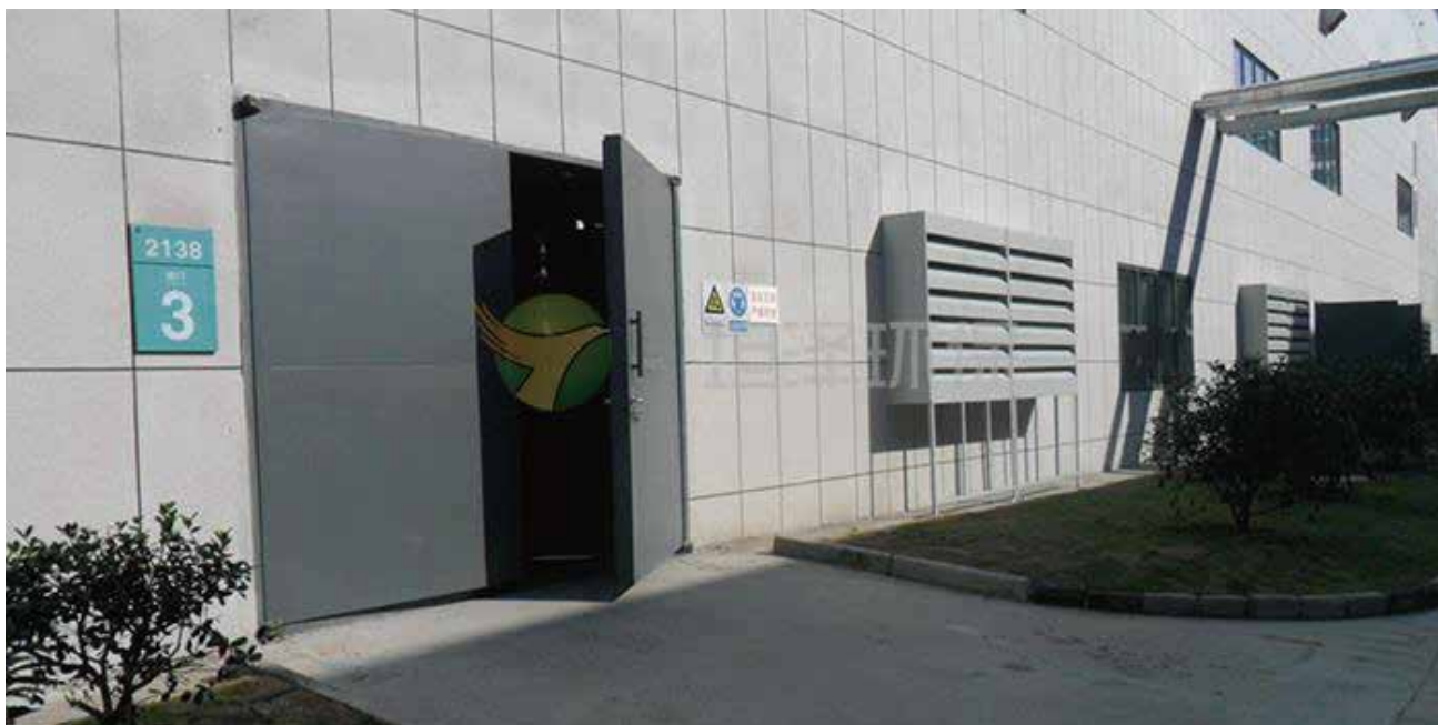
浙江昌海生物车间降噪项目