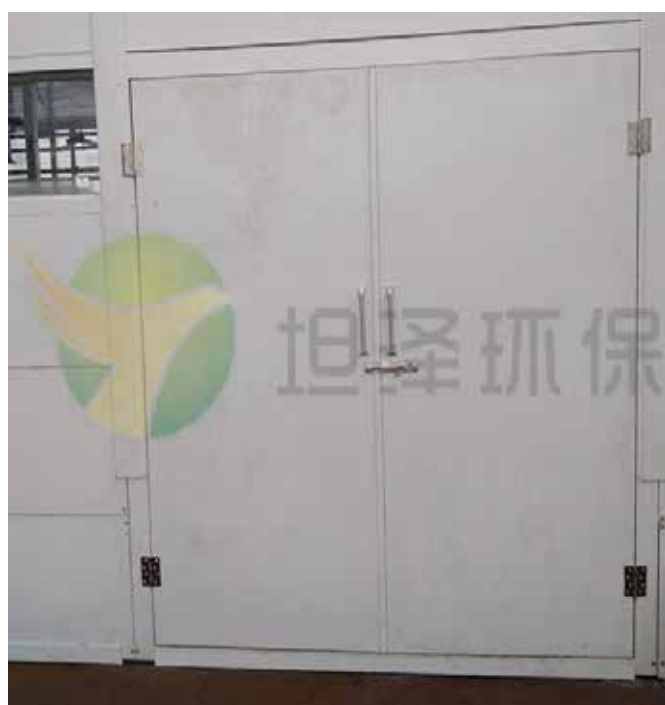
帝斯曼江山制药（江苏）有限公司 208 车间降噪工程（四期）